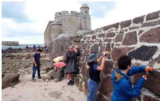
Août 2024 : chantier à Tatihou sur le mur de garantie.