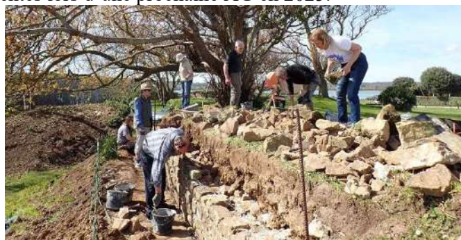
Avril 2024 : 2 e chantier à la Hougue.

FA précise qu'un second chantier a eu lieu à la Hougue en avril 2024 , avec la participation de l'association Orchis. Un 3 e chantier a eu lieu à Tatihou en août 2024 , cette année à la fois au fort de l'îlet et aussi sur le mur de garantie . FA n'entre pas dans les détails car les activités et les comptes de l'année 2024 seront présentés lors d'une prochaine AG en 2025.