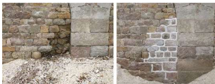
Août 2022 : exemple de brèche comblée au cours de la semaine.