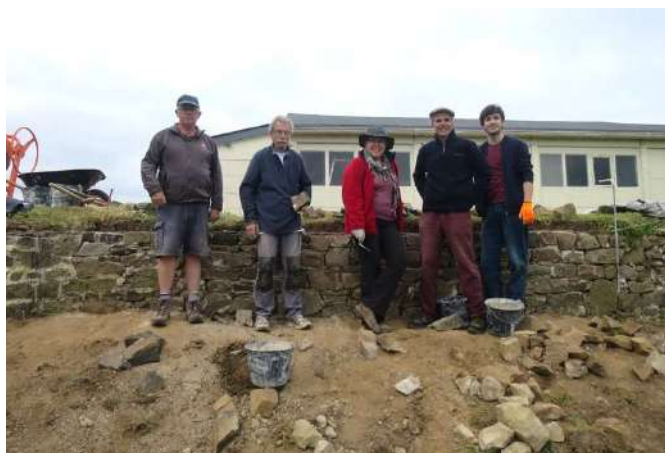
Mai 2023 : réparation d'un segment effondré du parapet à l'arrière du glacis.