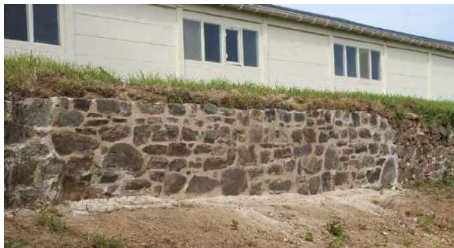
4 m de parapet réparé.