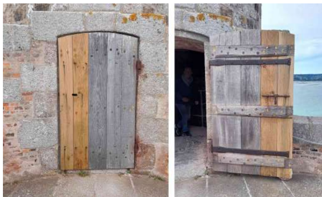
Juin 2023 : LPMH finance la réparation de la porte de la plateforme de la Hougue.

BM avait fait réaliser des devis pour la réparation de la porte en chêne de la plateforme supérieure de la Hougue . Une fois l'autorisation obtenue par la DRAC, LPMH a mandaté et rémunéré Olivier Brix, menuisier expérimenté, pour effectuer cette réparation.