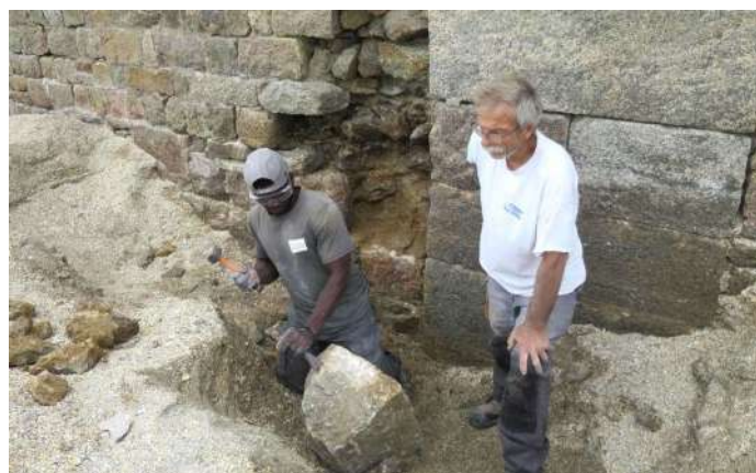
Un bénévole REMPART retaille un bloc de granite avec les conseils du chef de chantier.