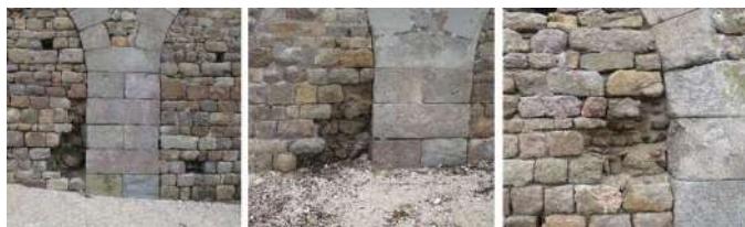
Brèches sur le rempart Est.

Fort du succès du premier chantier d'août 2022, LPMH est autorisé à organiser un 2 e chantier au fort de l'îlet en août 2023 pour combler des brèches sur le rempart Est.