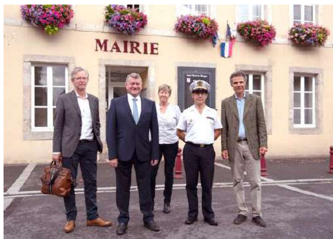
Septembre 2021 : signature de la convention avec la Marine