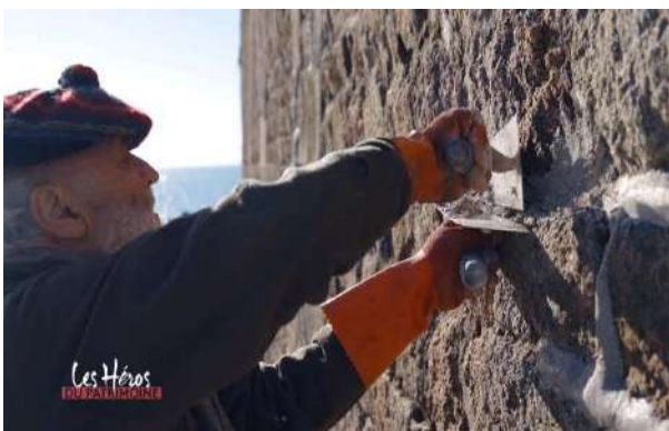
France 3 : émission Les Héros du Patrimoine .