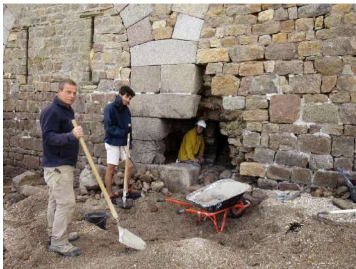
Août 2022 : la brèche de 3 m 3 est dégagée.