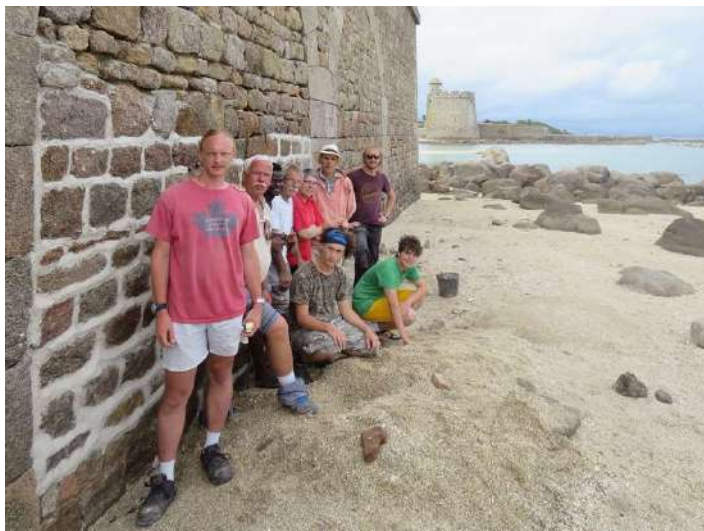
Août 2022 : LPMH accueille pendant une semaine 4 bénévoles du réseau REMPART.